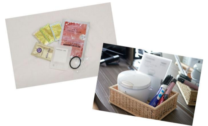
女性用アメニティ・貸出用備品 ※画像はイメージです

※ ビデオオンデマンドは通常フロアのみ。プレミアムフロアでは衛星放送WOWOWをご視聴いただけます。 ※ 女性用アメニティはロビーにご用意しております。