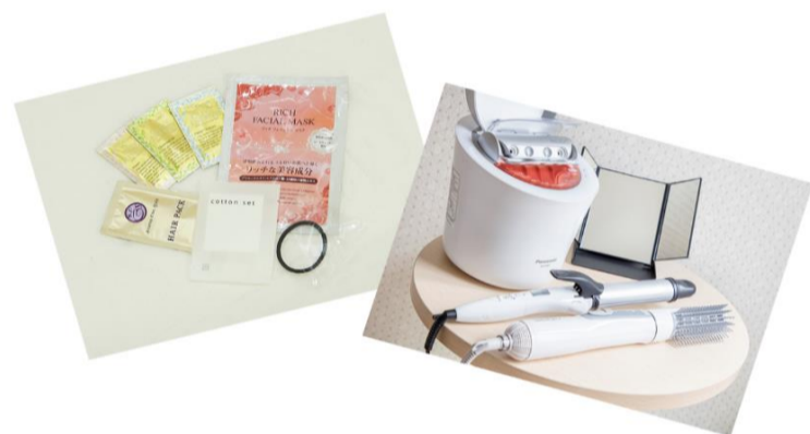
■ 女性用アメニティ・貸出用備品 ※画像はイメージです