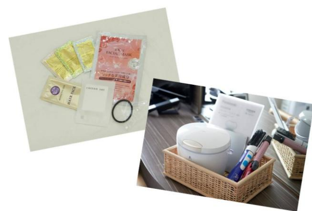
女性用アメニティ・貸出用備品 ※画像はイメージです

※ 女性用アメニティはチェックイン時にフロントでお渡しします。 ※ 携帯充電器はフロントにて貸し出しとなります。