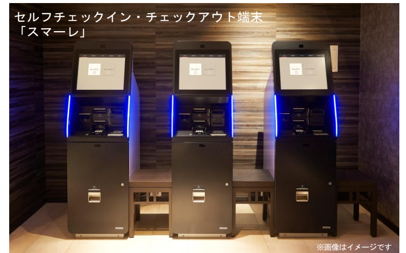
セルフチェックイン・チェックアウト端末 「スマーレ」