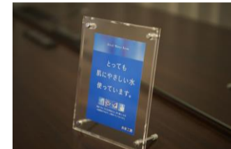
“良水工房”の浄水システムを設置し、客室の洗面台やシャワー、トイレをはじめ、ホテル内すべての水を優しい水に変えています。