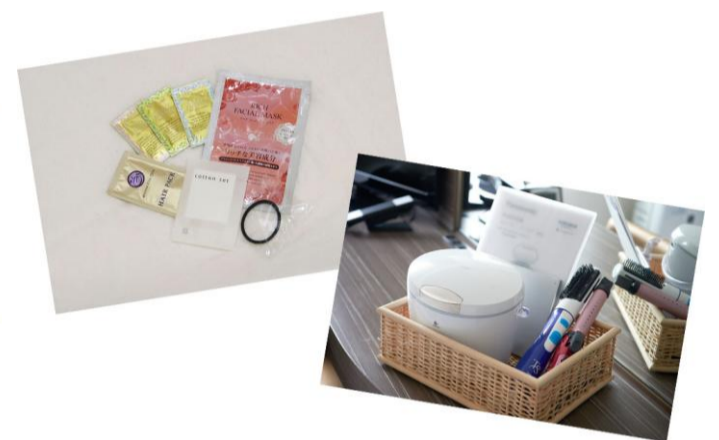
■ 女性用アメニティ・貸出用備品 ※画像はイメージです

※ 女性用アメニティはフロントにご用意しております。 ※ 携帯充電器はフロントにて貸し出しとなります。