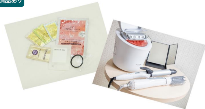
女性用アメニティ・貸出用備品 ※画像はイメージです